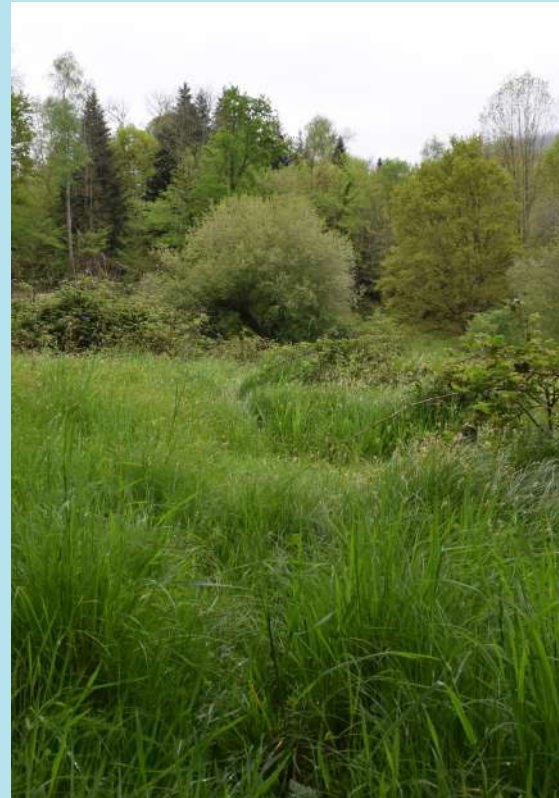
Zone humide en cours de fermeture à Sengouagnet (31)

A ce jour, le dossier de demande de Déclaration d'Intérêt Général et de déclaration de travaux au titre de la loi sur l'eau est en instruction par les services de l'Etat.