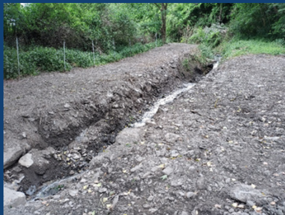
APRES TRAVAUX - Ruisseau du Picoun à Antignac (31)