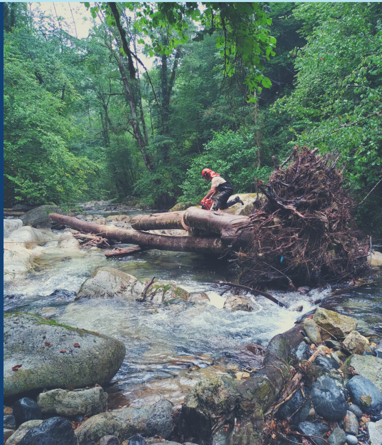
Travaux d'enlèvement d'embâcles sur le Ger (31)