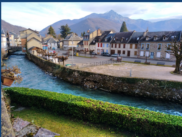
La Pique à Cierp-Gaud (31)

CONSEILS & ACCOMPAGNEMENT DES PROPRIETAIRES RIVERAINS (PRIVES ou PUBLICS) : l'équipe du syndicat accompagne sur le volet technique et/ou administratif toute personne souhaitant réaliser des travaux sur les cours d'eau.