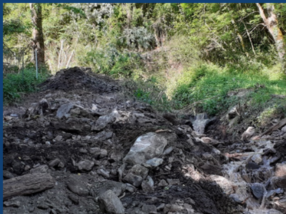
AVANT TRAVAUX - Ruisseau du Picoun à Antignac (31)

Plusieurs torrents ont transporté des matériaux et déposé au niveau des cônes de déjections (soit dans le lit naturel, soit dans des ouvrages de correction torrentielle), empêchant alors le libre écoulement. Il demeure un risque résiduel important de divagation des torrents dans des secteurs à enjeux. C'est pourquoi, dans le cadre de la compétence GEMAPI, le SMGA a souhaité mener des travaux d'urgence de restauration de la capacité des écoulements pour la sécurité des biens et des personnes. A noter que cette intervention est ponctuelle suite à un épisode particulier et ne présage pas de la gestion future du torrentiel et des ouvrages dédiés à la gestion du risque torrentiel. Les travaux ont été effectués après l'obtention des arrêtés préfectoraux.